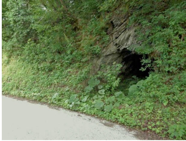
A Pusno felől Srednje felé vezető út bal oldalán található kaverna, amit nagy valószínűség szerint a közelben települt olasz tüzérség használt

ugyan nem tudták meghatározni saját helyzetüket, de biztosak voltak, hogy a második olasz állások mögé kerültek.