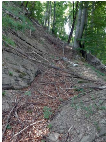
Avarral félig betemetett olasz lövészárkok kb. ott, ahol Bertalan betört az olasz állásokba