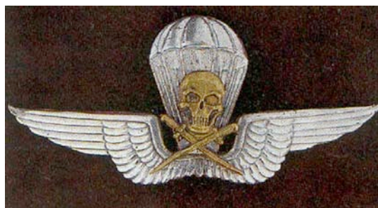
A Magyar Királyi Honvédség ejtőernyős jelvénye a rohamcsapatok szimbolikájából átvett koponyával