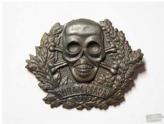
Első világháborús rohamosztagos jelvény a tipikus jelképpel: a koponyával

Az első világháborús rohamcsapatok jelvényének szimbolikus jelentésű „koponyája” sok korabeli szakmai vita után nem véletlenül került bele az első magyar katonai ejtőernyős jelvénybe is: viselői – békében és háborúban egyaránt – naponta néztek szembe a halállal, hiszen már maga az ejtőernyőzés is megköveteli, hogy a katona leküzdje ösztönös félelmeit, amikor kiveti magát a repülőgép ajtaján.